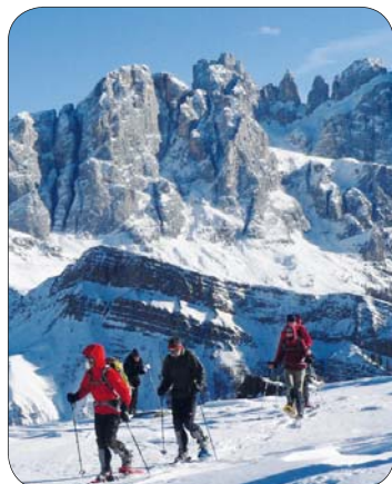
Copertina 1 e 4: 3° Corso di Escursionismo invernale - Juribrutto

La Segreteria è aperta: - il martedì dalle 21.00 alle 23.00 - il mercoledì dalle 18.00 alle 19.00 - il venerdì dalle 11.00 alle 12.30